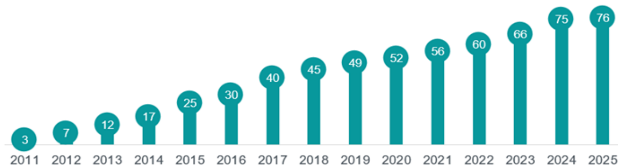
Gráfica 1 Centros de Justicia para las Mujeres (CJM), según año de inicio de operaciones al 30 de junio de 2025 (número de centros)

La apertura e inicio de operaciones de los CJM en México ha sido constante desde 2011 a la fecha; los primeros CJM se abrieron en Campeche, Chiapas y Chihuahua. El más reciente inició operaciones en 2025 en Mexicali, Baja California. De esta manera, al 30 de junio de 2025 ya operaban 76 CJM, distribuidos en las 32 entidades federativas (ver gráfica 1).